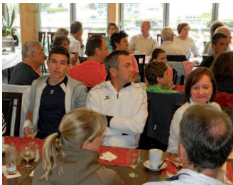
Gemütlicher Brunch vor dem Spiel