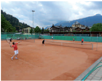
Viel Betrieb auf der Anlage