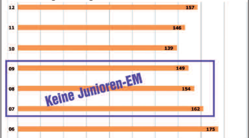
Entwicklung TCK-Mitglieder 2006-2012

Wir engagieren uns für Ihre persönlichen Ziele .