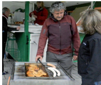
Dank dem Einsatz etlicher Clubmitglieder kam über die Festwirtschaft ein schöner Betrag in die Clubkasse.