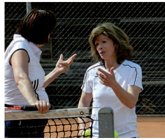
Wie ist der Spielstand?

Den Ligaerhalt in der 1. Liga konnte sich das Herrenteam 35+ erst nach der Gruppenphase. Im ersten Abstiegsspiel gegen Hausen a. A. gewannen sie souverän und bleiben somit in der 1. Liga. Die Mannschaft ist nun aber gemeinsam älter geworden und spielt ab 2013 neu in der 1. Liga Herren 45+.