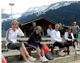
Ein Gruppe schaut zu und die andere spielt