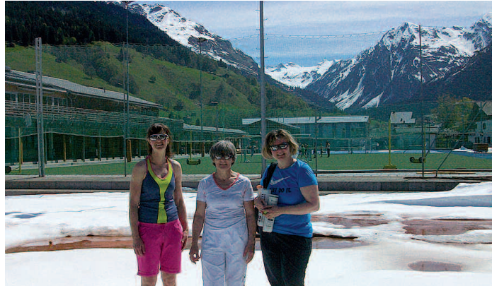
Drei Frauen im Schnee möchten lieber Interclub spielen.